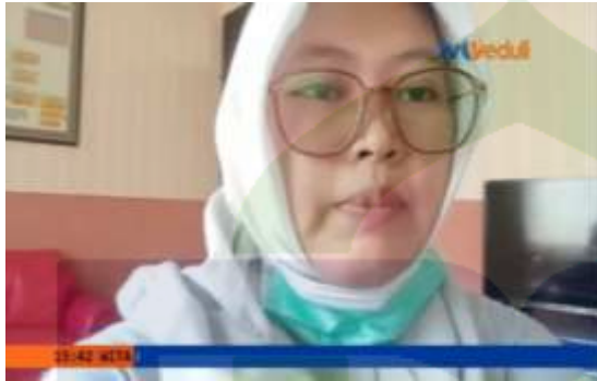
Ket. Reporter Peduli News sedang melaporkan berita dari lapangan