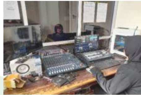
Ket. Wawancara dengan Kru Mcr Peduli News TV Peduli