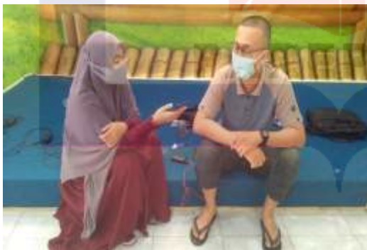
Ket. Wawancara dengan Cameraman Peduli News TV Peduli