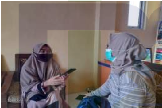
Ket. Wawancara dengan Reporter Peduli News TV Peduli