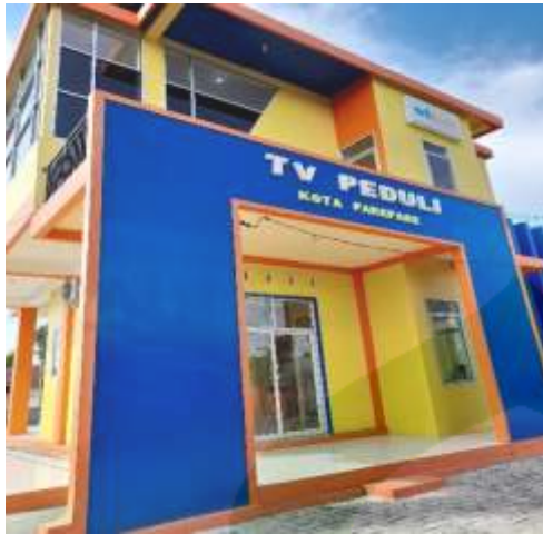
Ket. Tv Peduli Parepare