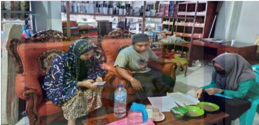
Wawancara dengan Calon jamaah haji Kementerian Agama Kabupaten Pinrang