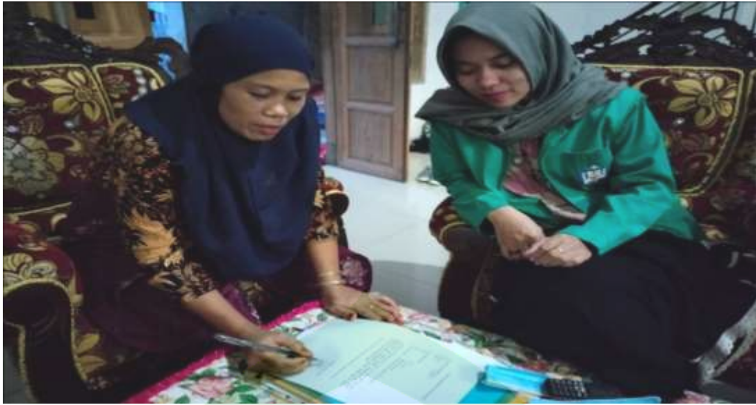
Wawancara dengan Calon jamaah haji Kementerian Agama Kabupaten Pinrang