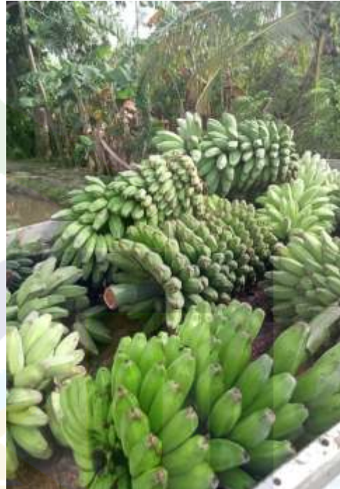
Proses Pengangkutan pisang