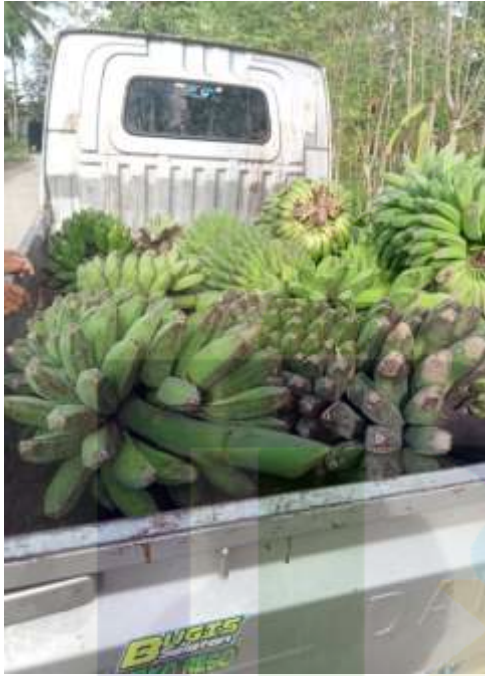
Proses pengangkutan pisang