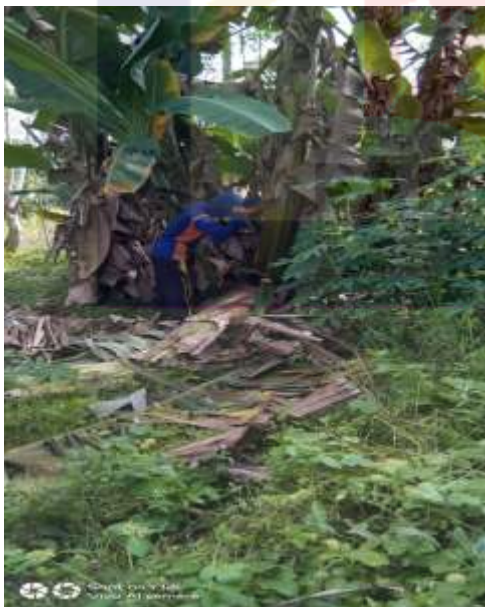
Proses Penebangan pisang`