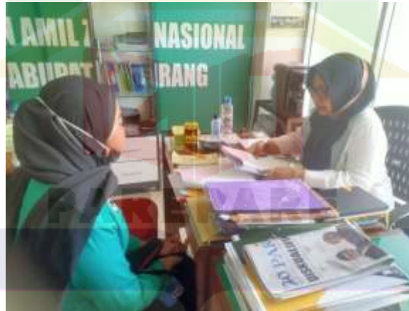
Gambar 2. Wawancara dengan Wakil Baznas Kab. Pinrang