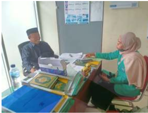
Gambar 3. Wawancara dengan Wakil Ketua Baznas Kab. Pinrang