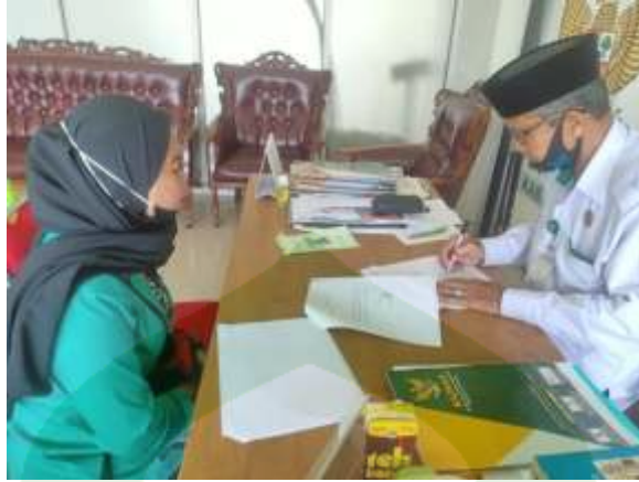
Gambar 1. Wawancara dengan Ketua Baznas Kab. Pinrang