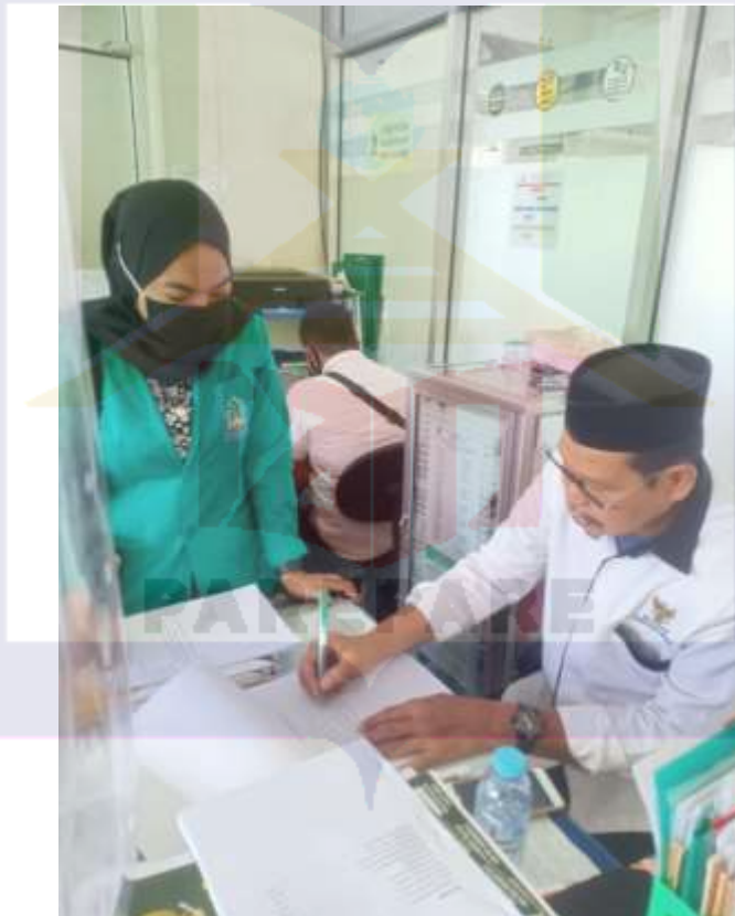
Gambar 4. Wawancara dengan sekretaris Baznas Kab. Pinrang