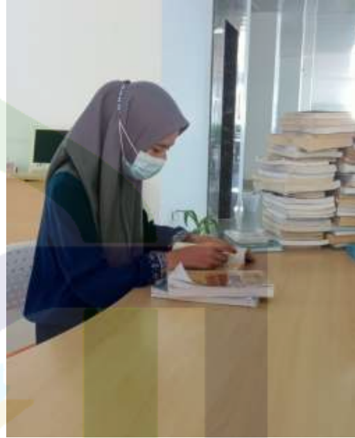
2. Membaca & mengumpulkan materi yang terkait dengan penelitian