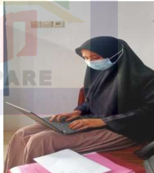
3. Proses pengerjaan skripsi