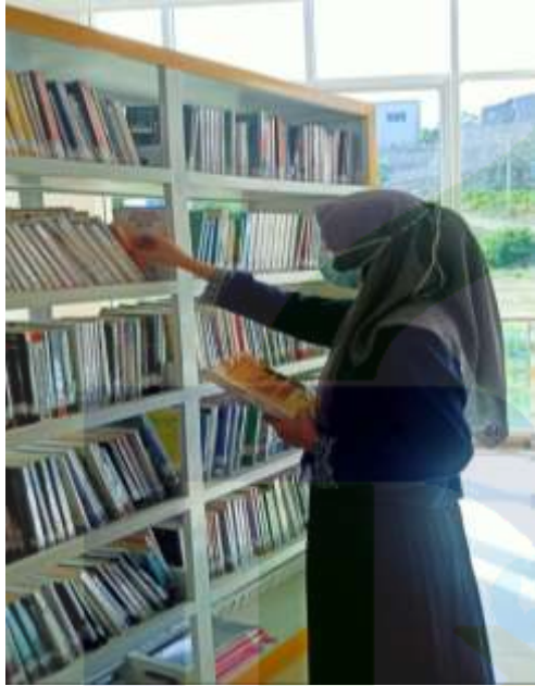
1. Mencari referensi terkait penelitian