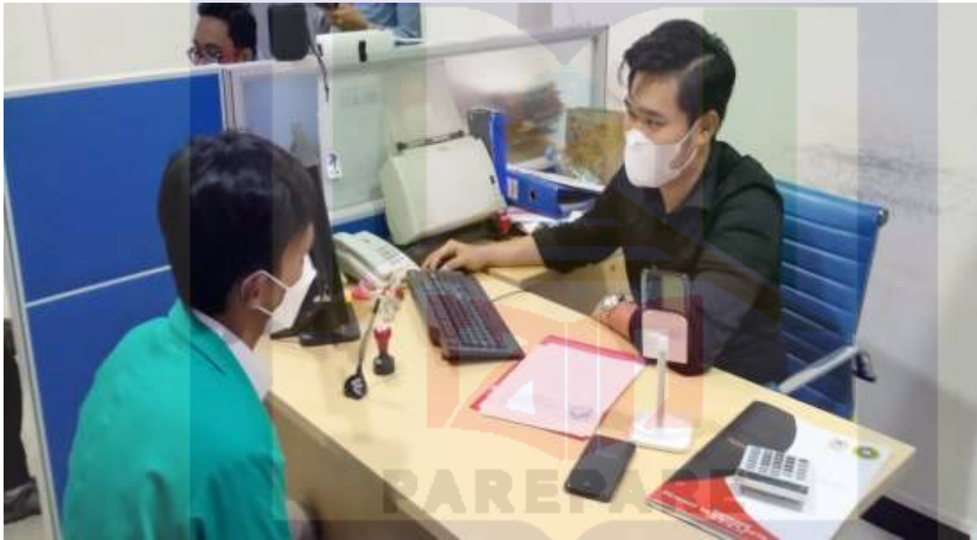
DOKUMENTASI WAWANCARA DENGAN FINANCING SERVICE