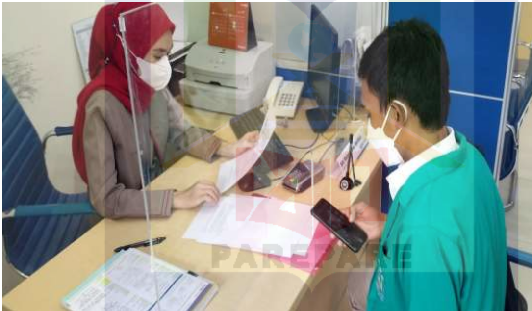
DOKUMENTASI WAWANCARA DENGAN COSTUMER SERVICE