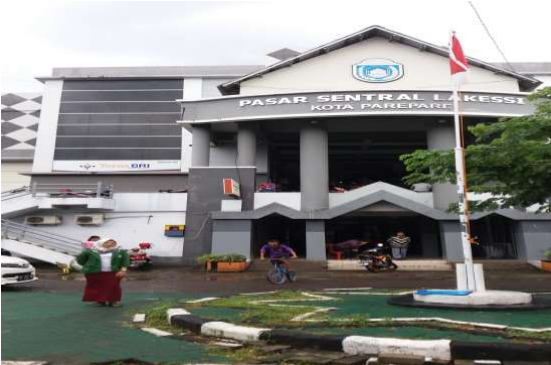
Foto Tempat Penelitian Pasar Lakessi Parepare