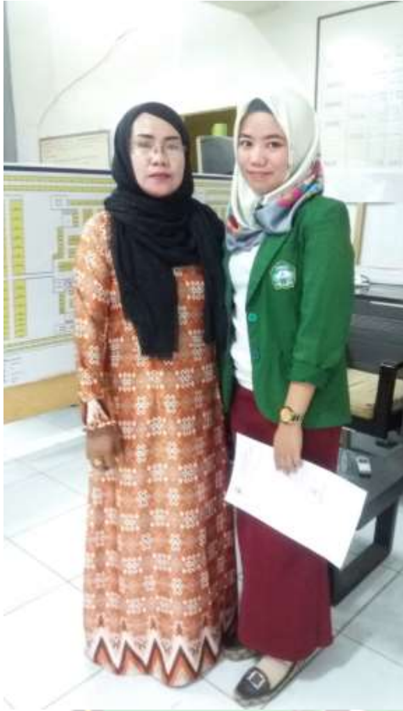
Foto saat Membagikan Kuesioner dengan Pedagang