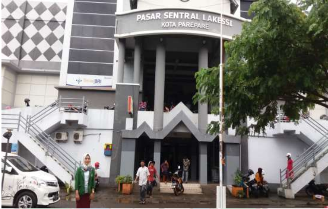
Foto Bersama Kepala UPTD Pasar Kota Lakessi