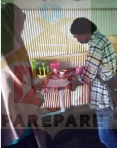
Wawancara dengan pekerja UD. Sriwijaya Parepare