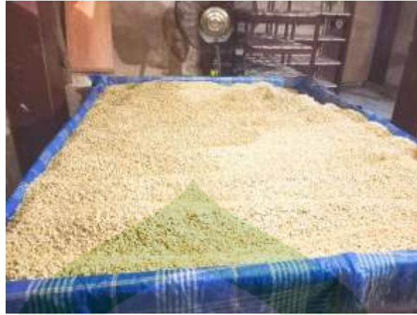
Kedelai yang sudah dicuci