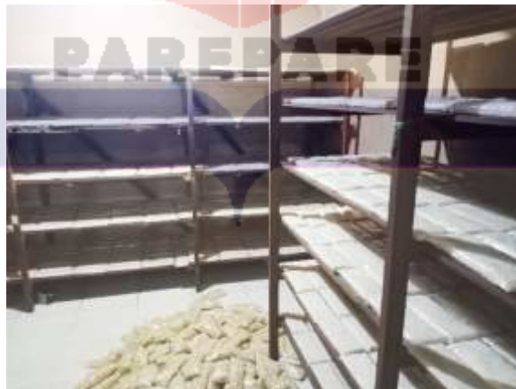
Tempe yang sudah dikemas akan disimpan