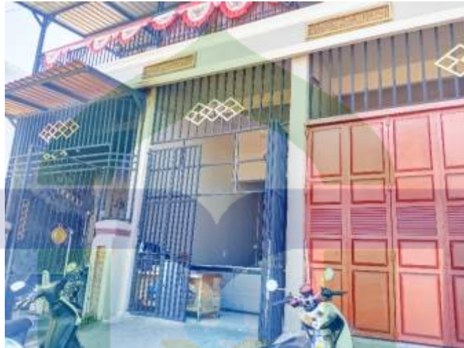
UD. Sriwijaya tampak depan