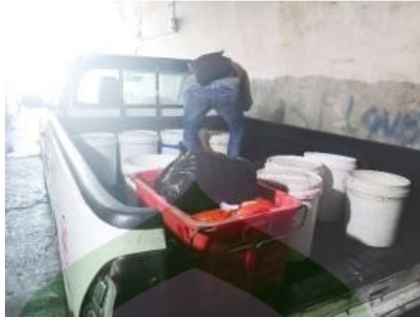
Pengiriman ke konsumen