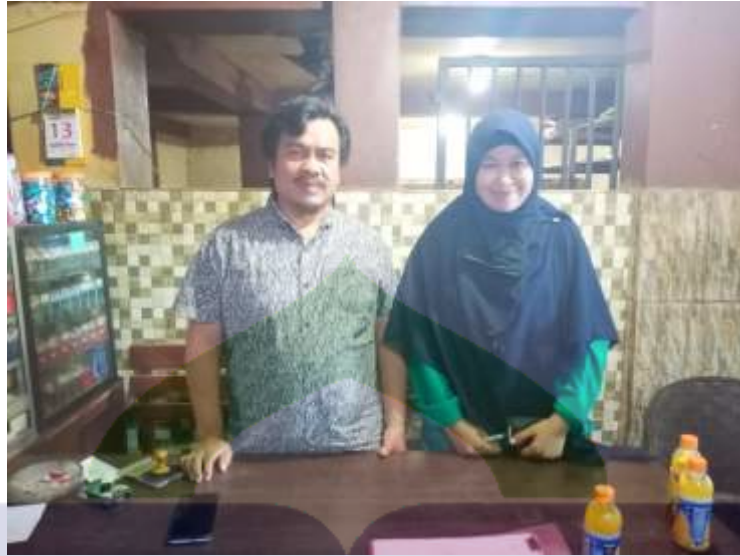
Wawancara dengan Pemilik