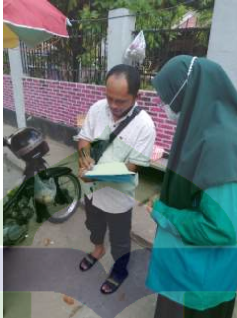
Wawancara dengan konsumen