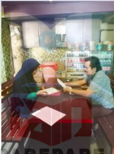
Wawancara dengan Pemilik