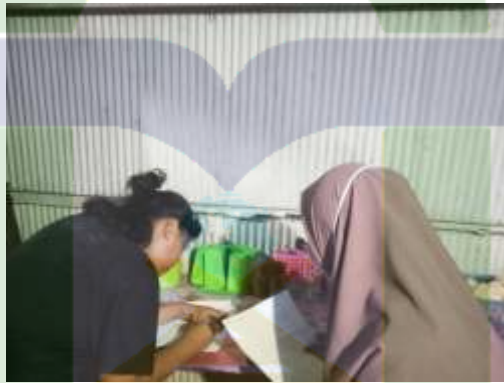
Wawancara dengan konsumen