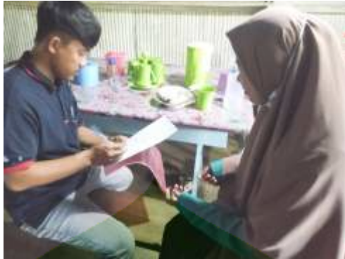
Wawancara dengan pekerja UD. Sriwijaya Parepare