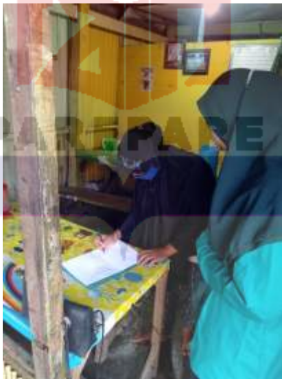
Wawancara dengan konsumen