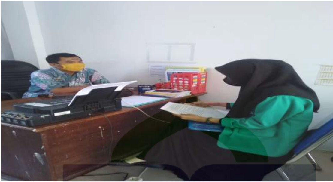
Gambar 1. Wawancara dengan Staff Kantor Dinas Kota Parepare