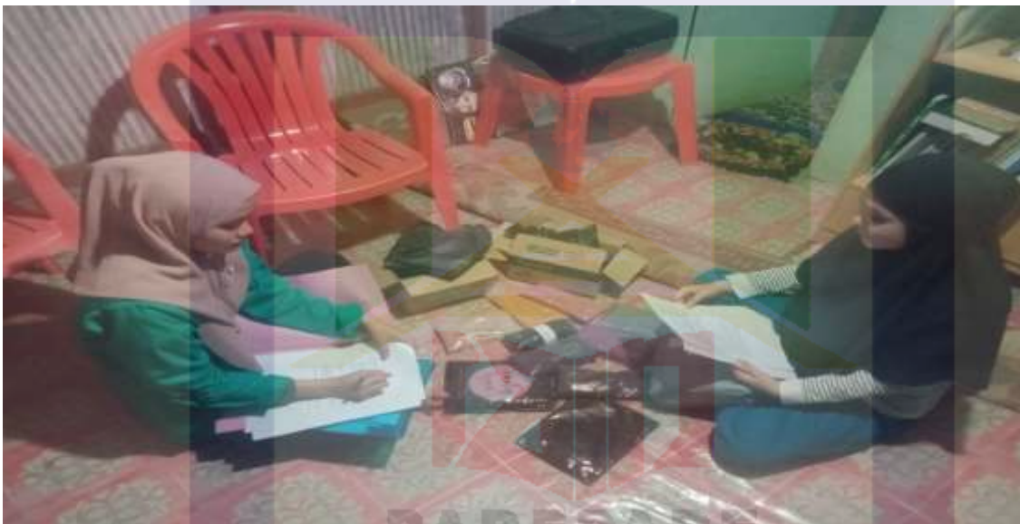
Gambar 6. Wawancara dengan selaku pihak pelaku usaha online dropship di Kota Parepare.