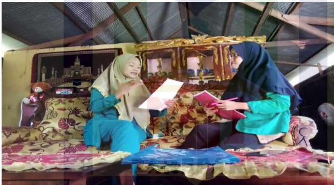
Gambar 4. Wawancara dengan selaku pihak konsumen online dropship di Kota Parepare.