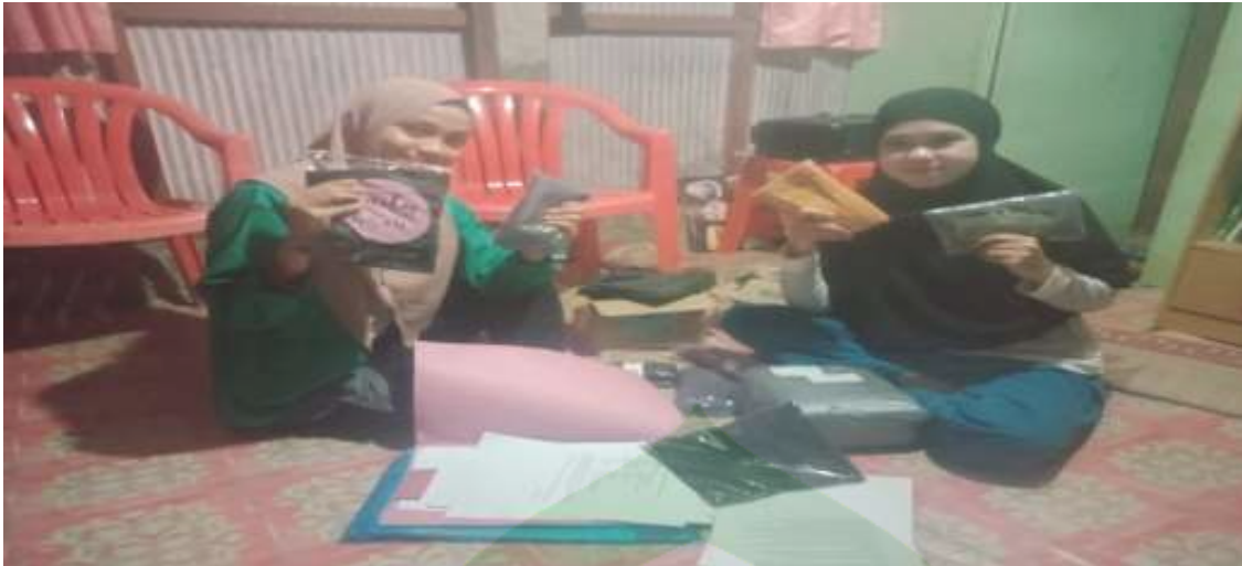
Gambar 5. Barang yang akan dikirim kepada pihak konsumen