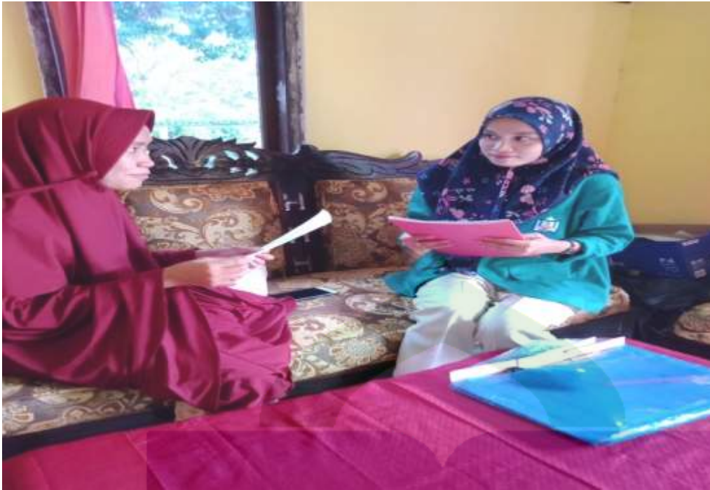
Gambar 11. Wawancara dengan selaku pihak konsumen online dropship di