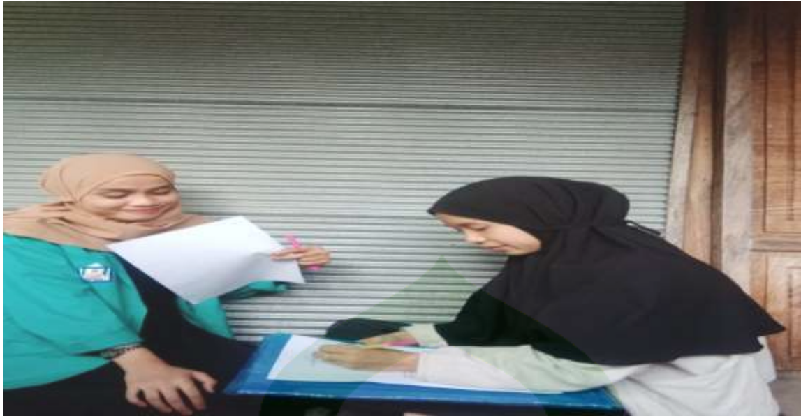
Gambar 3. Wawancara dengan selaku pihak konsumen online dropship di Kota Parepare.