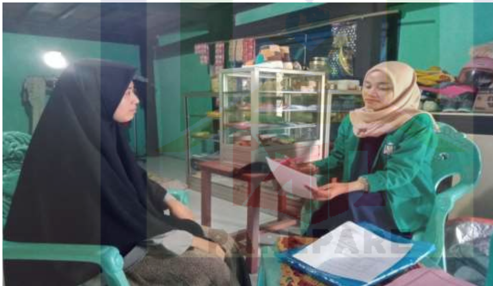
Gambar 10. Wawancara dengan selaku pihak konsumen online dropship di Kota Parepare.