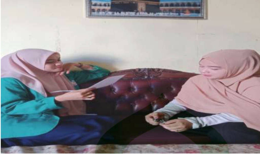
Gambar 7. Wawancara dengan selaku pihak konsumen online dropship di Kota Parepare.