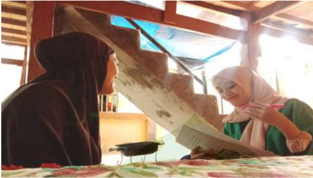
Gambar 9. Wawancara dengan selaku pihak pelaku usaha online dropship di Kota Parepare.