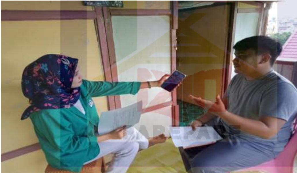
Gambar 8. Wawancara dengan selaku pihak konsumen online dropship di Kota Parepare