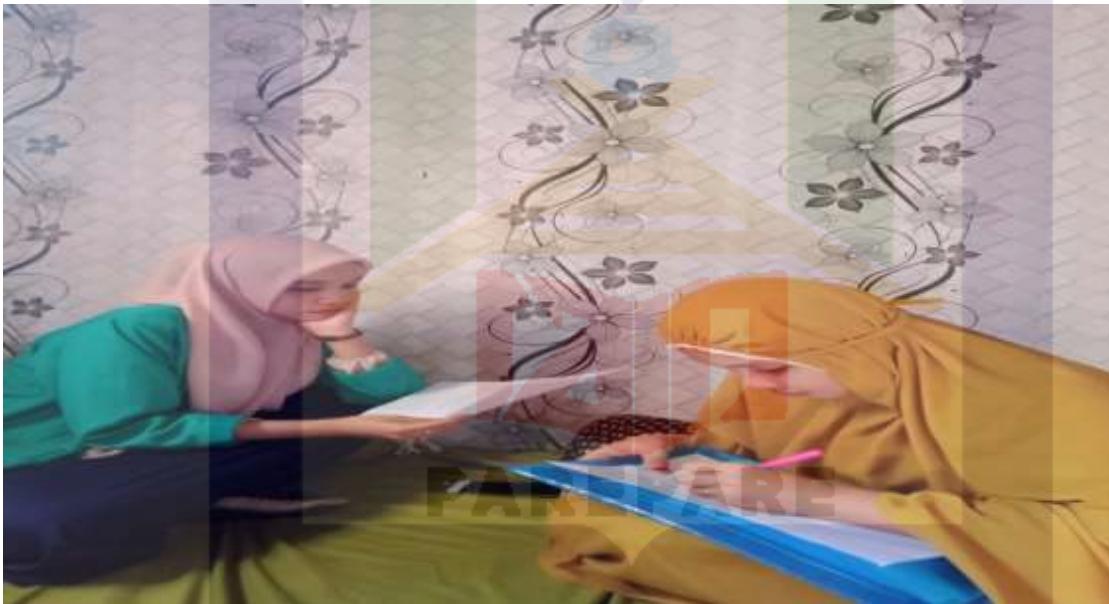
Gambar 2. Wawancara dengan selaku pihak penjual online Dropship di Kota Parepare