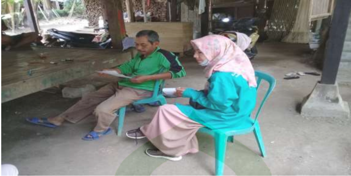
Kepala lingkungan kassa (Sapari)