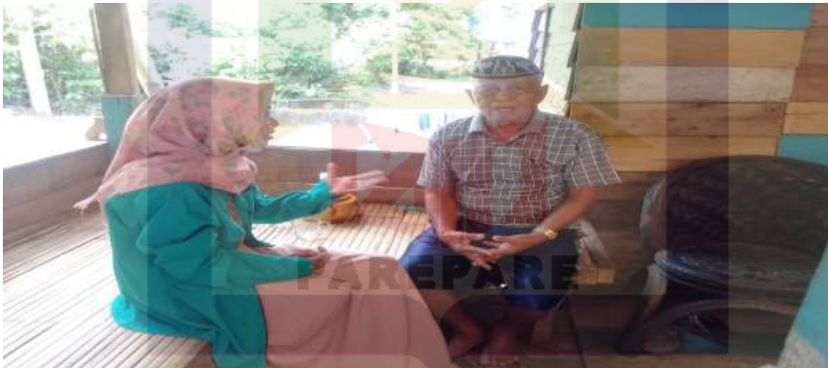
Tokoh masyarakat (puang podding)