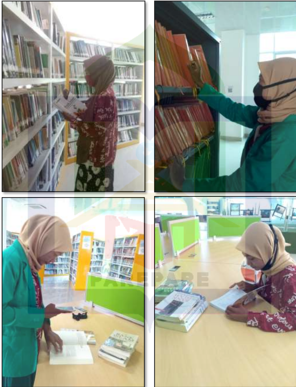
Lampiran 1. Dokumentasi.