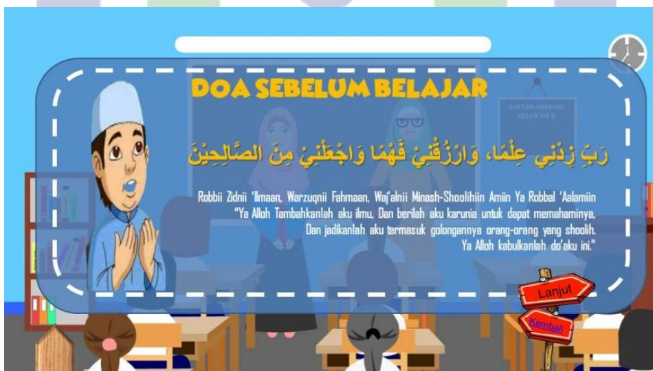
Slide Doa setelah revisi