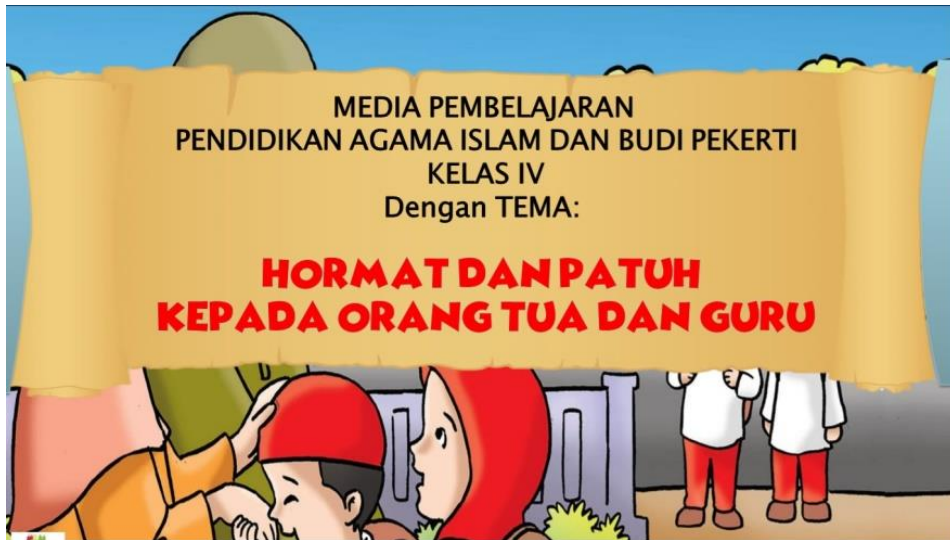
Slide Judul setelah Revisi