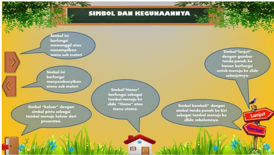
Slide petunjuk penggunaan media setelah revisi