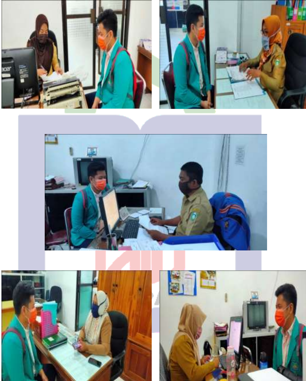
Gambar 5. Pada saat melakukan wawancara terhadap staff bagian hukum DPRD Kota Parepare