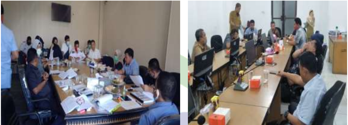
Gambar 2. Pada Saat Rapat tingkat pertama Anggota DPRD Kota Parepare bersama pemerintah kota Parepare