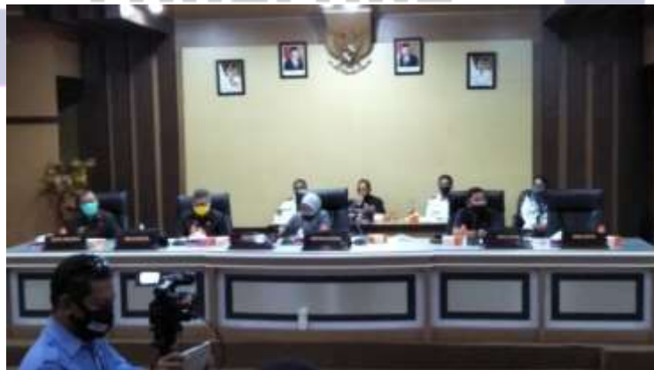
Gambar 3. Pada Saat Rapat Tingkat Kedua (Paripurna untuk pengesahan Ranperda)