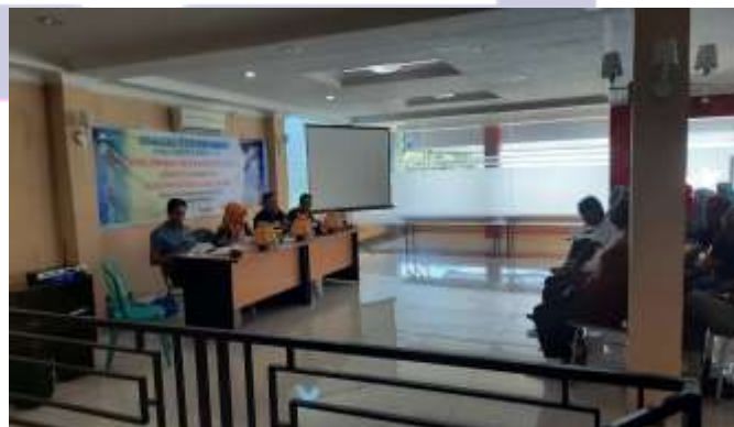
Gambar 4. Pada Saat Anggota DPRD Kota Parepare mensosialisasikan Perda yang telah disahkan kepada masyarakat kota Parepare.