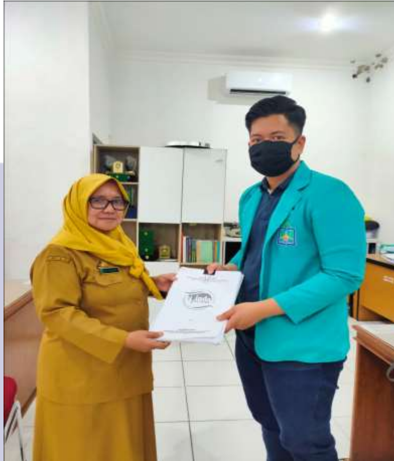
Gambar 1. Penyerahan data Proses pembentukan Perda Kota Parepare