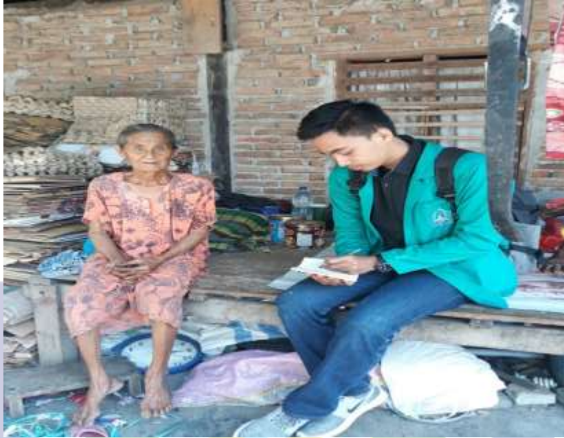
Gambar 2 (Wawancara dengan Ibu Mase' salah satu fakir miskin di Kota Parepare)