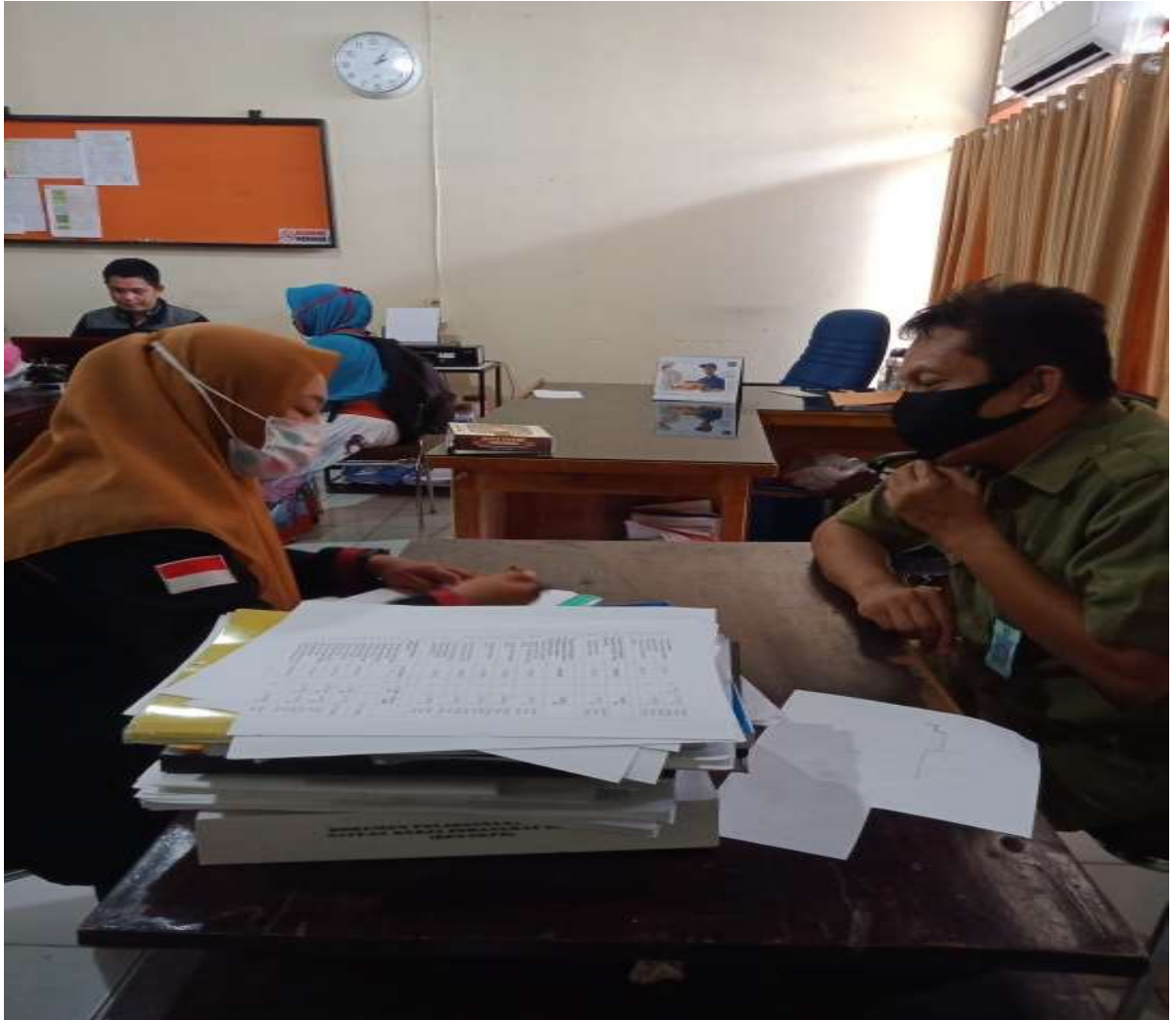
Gambar 2: Wawancara dengan pengawas pemerintahan