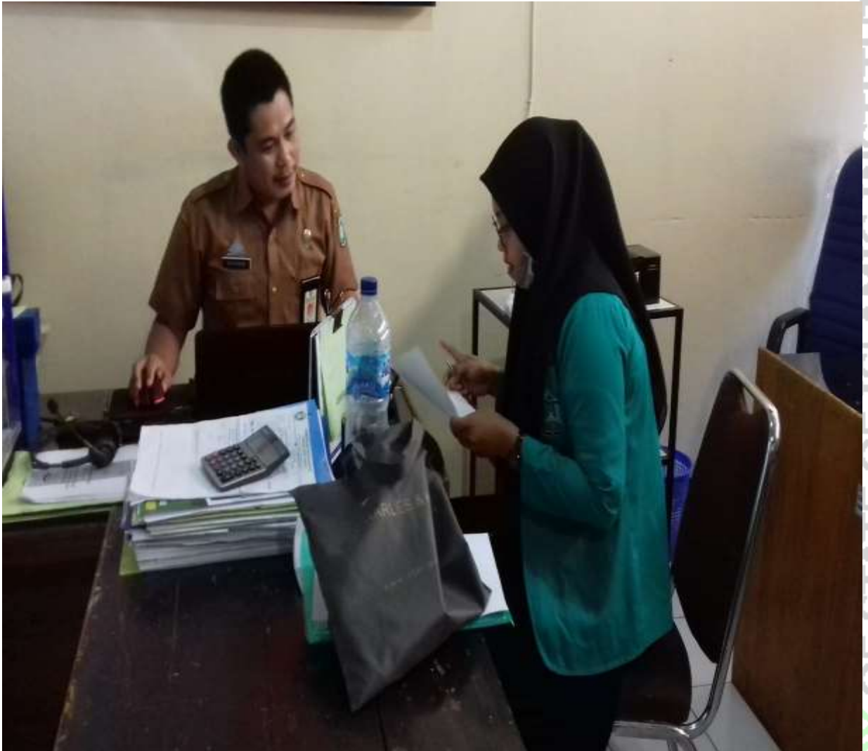
Gambar 1: Wawancara dengan auditor pemeriksa