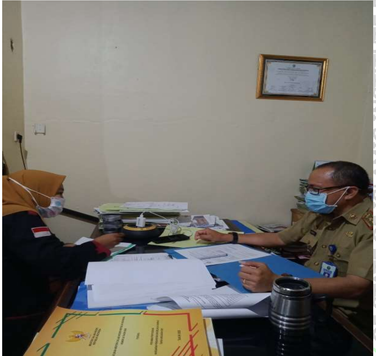
Gambar 4: Wawancara dengan Sekretaris Inspektorat Daerah