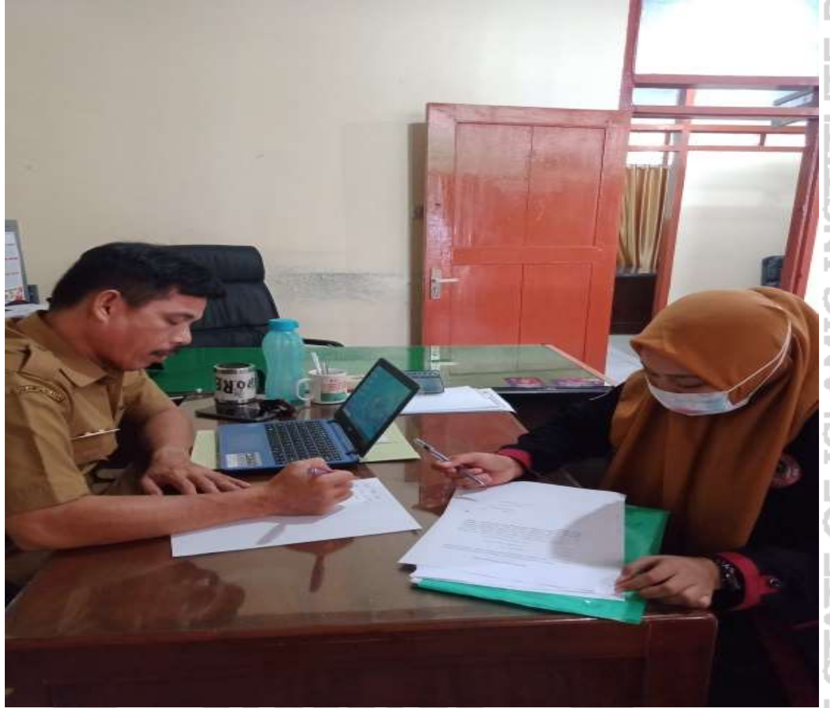
Gambar 3: Wawancara dengan Auditor pemeriksa