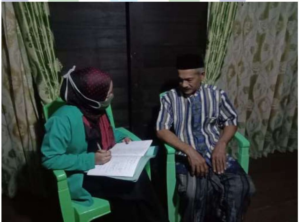
Wawancara dengan Sanro bola