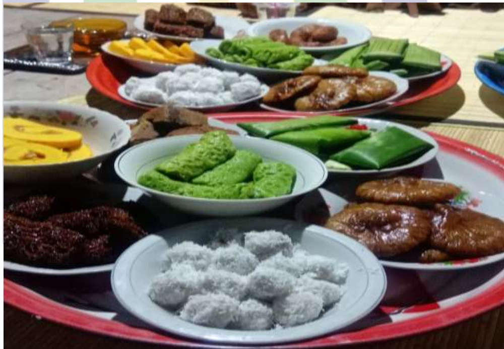
7 macam Kue Tradisional