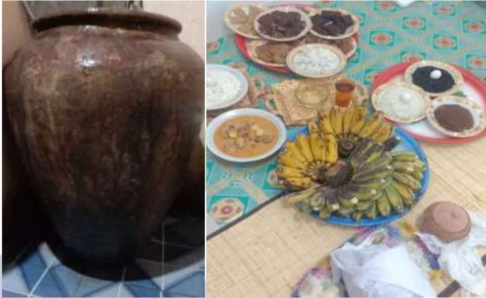
Alat-alat dan Bahan