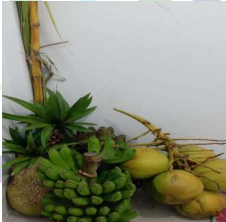
Pisang (loka), Kelapa (kaluku), Nangka (panasa)