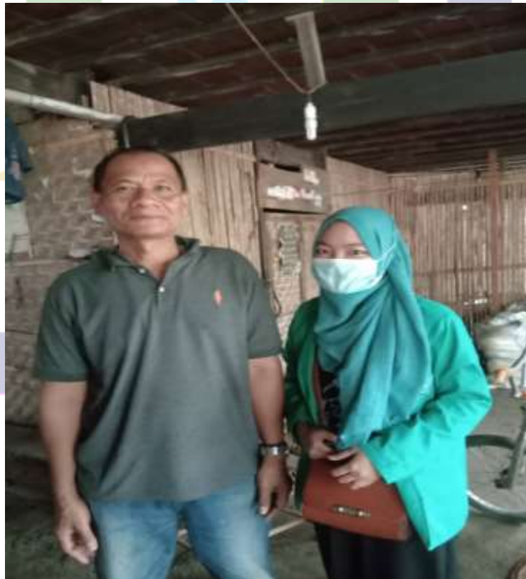
Wawancara dengan Panrita Bola