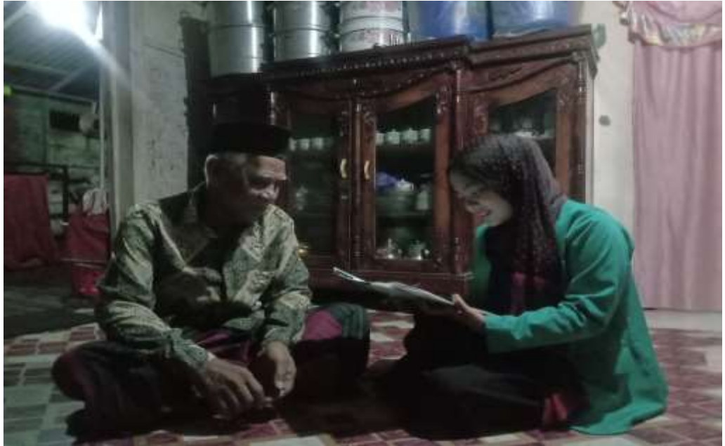
Wawancara dengan Imam Desa