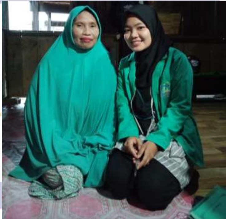
Wawancara dengan Masyarakat