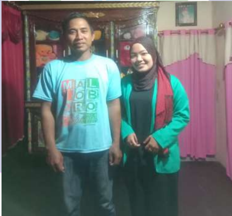
Wawancara dengan Tuan rumah