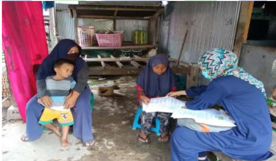
Gambar 4.3 Bimbingan Guru di Rumah Peserta Didik yang mengalami kesulitan belajar.

Bimbingan terhadap peserta didik merupakan upaya yang dilakukan oleh guru agar peserta didik yang mengalami kesulitan belajar dapat mengatasi kesulitan belajar yang dialami.