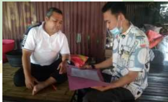
Wawancara dengan Pembina REMUS