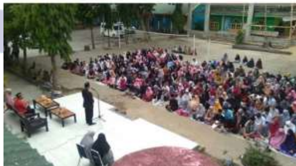
Kegiatan Pengajian Angkatan