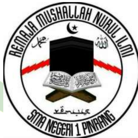
Logo Organisasi REMUS SMA Negeri 1 Pinrang