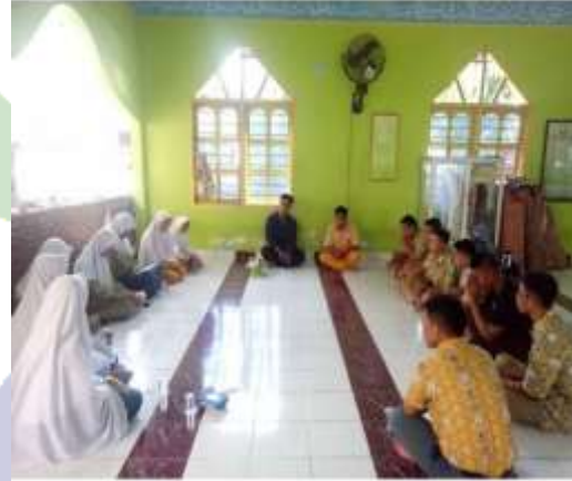
Pertemuan Rutin REMUS SMA Negeri 1 Pinrang