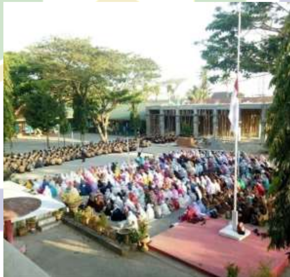
Kegiatan Literasi al'Quran