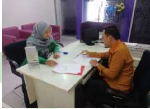
- wawancara sultan