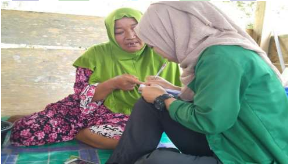
Foto saat melakukan wawancara dengan masyarakat