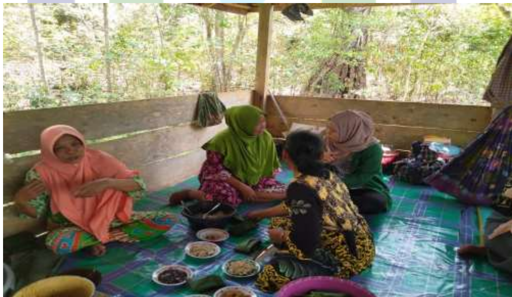
Foto saat melakukan wawancara dengan masyarakat