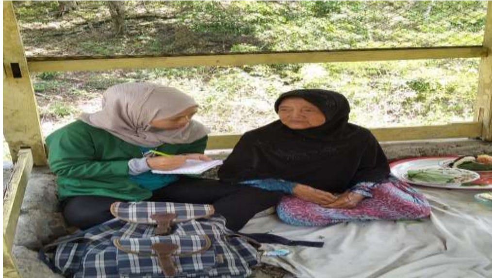
Foto saat melakukan wawancara dengan masyarakat