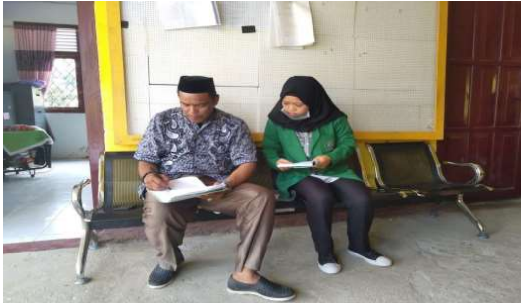
Foto saat melakukan wawancara dengan masyarakat