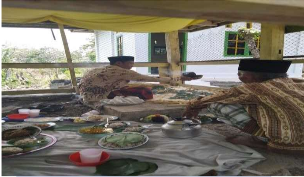
Foto saat melakukan membacakan doa-doa