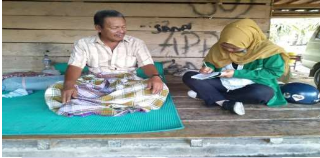
Foto saat melakukan wawancara dengan masyarakat