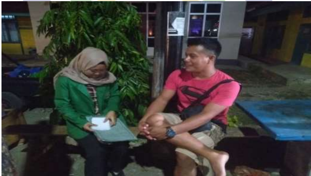
Foto saat melakukan wawancara dengan masyarakat