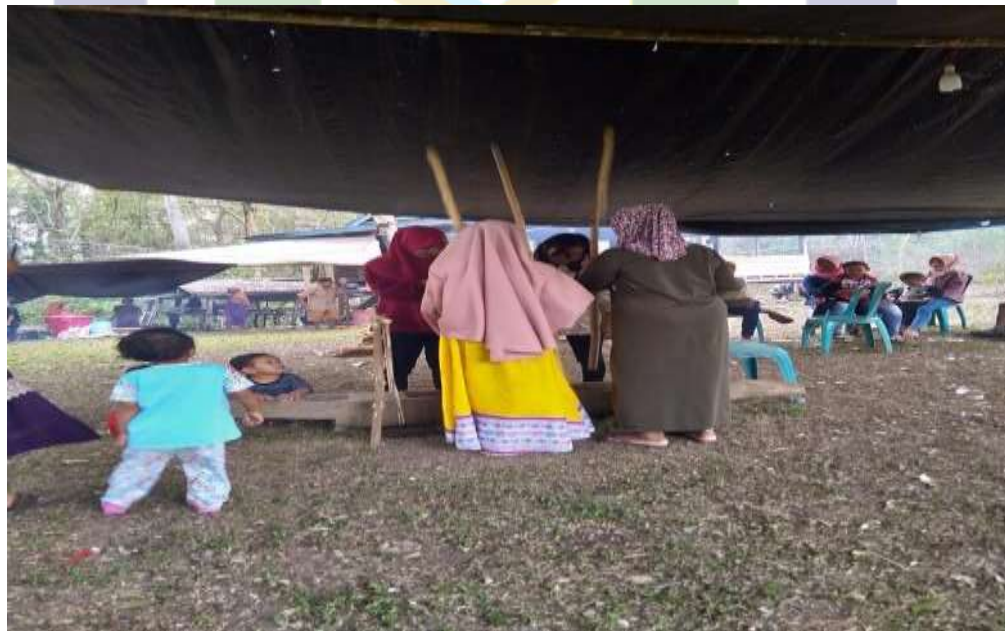
Foto saat melaksanakan tradisi Mappadedndang