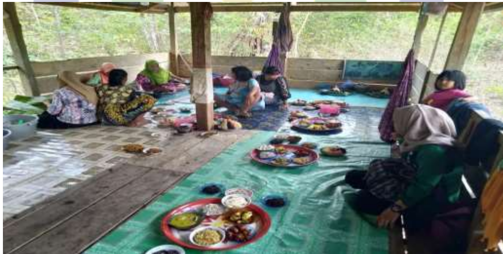
Foto saat melakukan persiapan mabaca