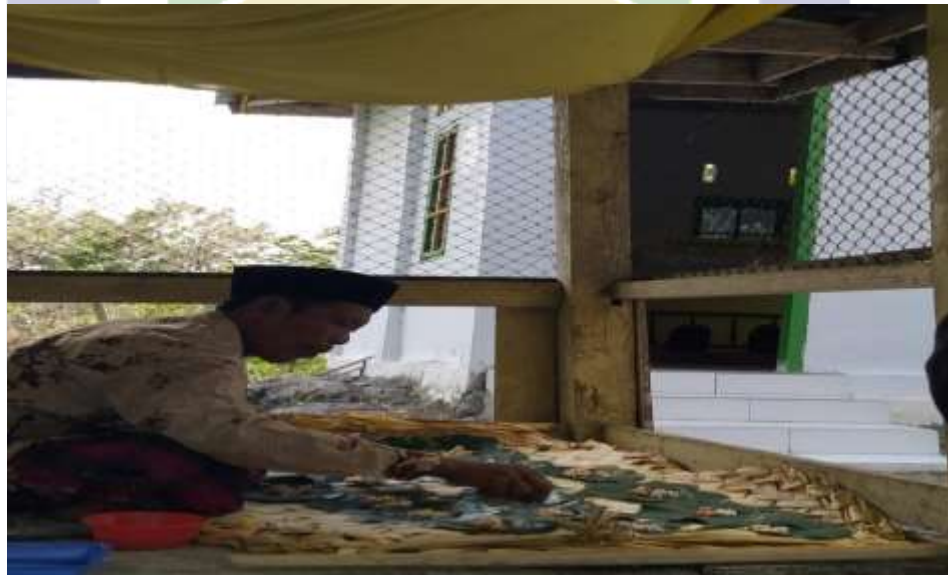
Foto saat persiapan pelaksanaan adat Pattuangeng