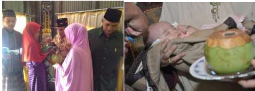
Tabel 4: Penyajian Buah Kelapa