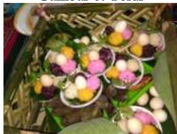
Tabel 9: Telur