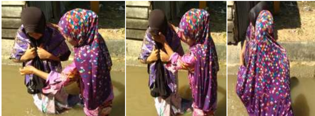
Tabel 14: Dio Darah Ute