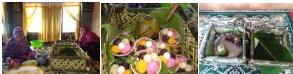
Tabel 5 :Penyajian Bala Suji