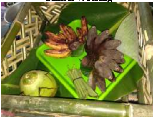
Tabel 10: Pisang