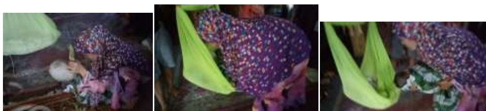
Tabel 17: Mappenre' Tojang