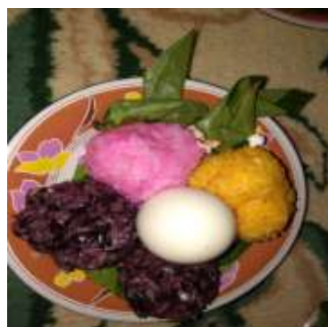
Tabel 8: Sokko' Patarrupa