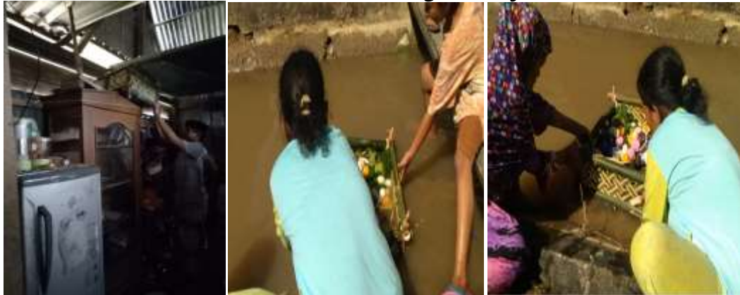
Tabel 13: Massorong Bala Suji