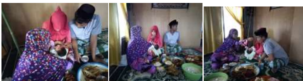
Tabel 16: Memakan Sesajian