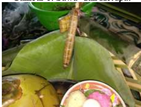
Tabel 11: Sawa' dan Ketupat