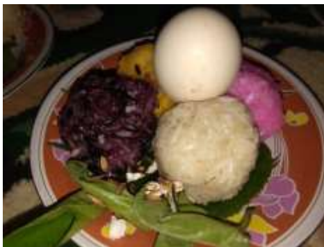
Tabel 7: Daun Sirih