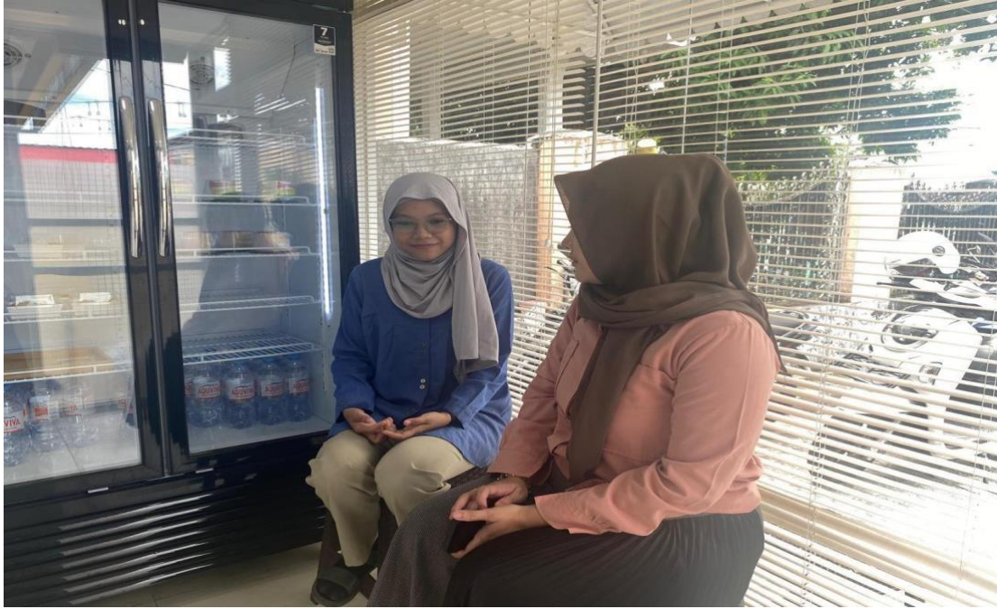
Wawancara dengan Bendahara