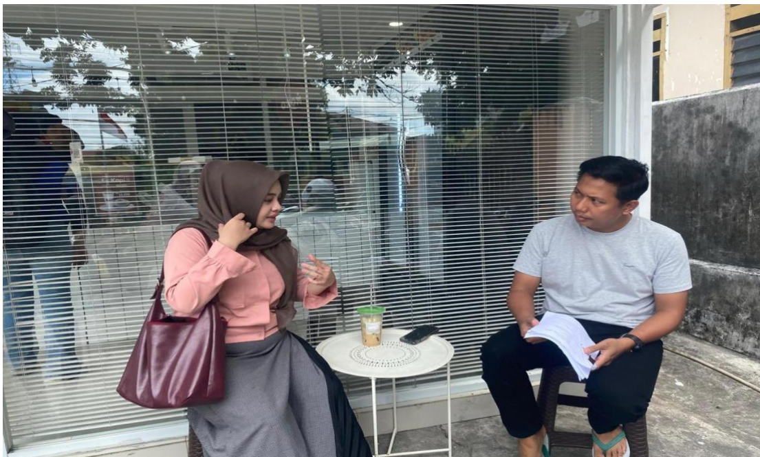
Wawancara dengan Owner MOKO Donuts