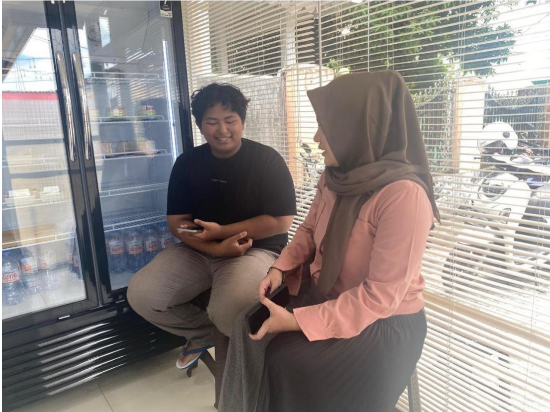
Wawancara dengan Pegawai MOKO Donuts