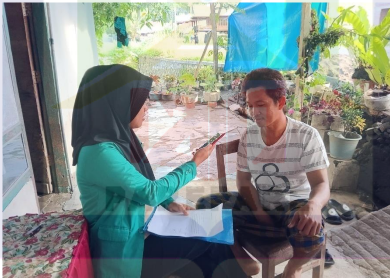
Gambar: Wawancara dengan Bapak Cottang dan Bapak Lias selaku Petani Jagung, Selaku Muqtaridh (Pihak Peminjam)