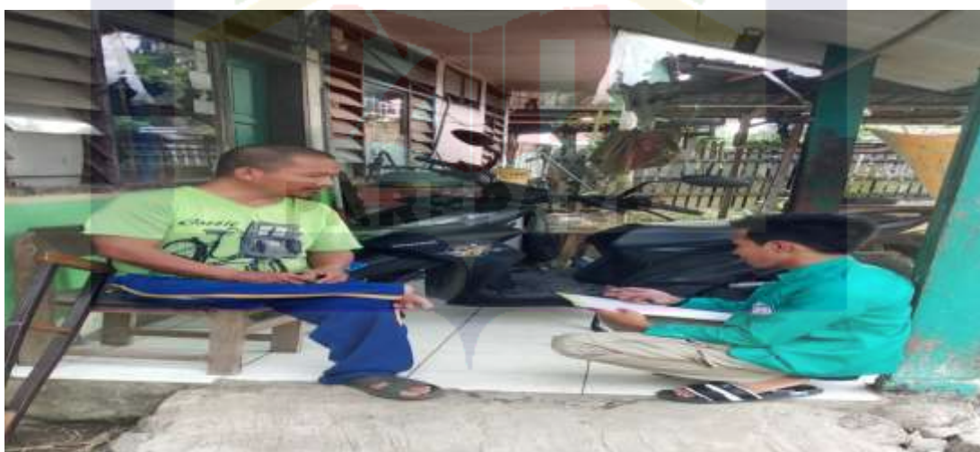
Wawancara Masyarakat Desa Mattiro Ade