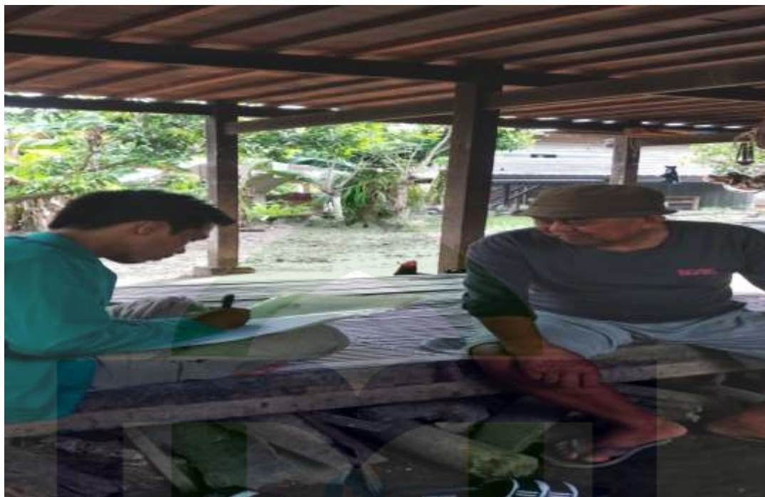
Wawancara Masyarakat Desa Mattiro Ade