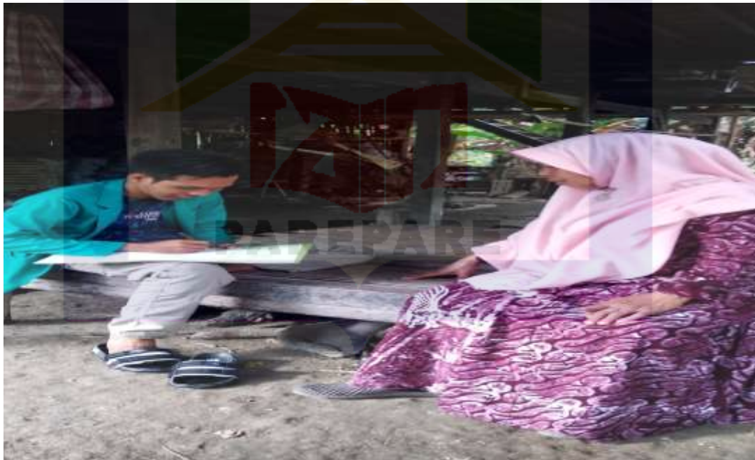
Wawancara Masyarakat Desa Mattiro Ade