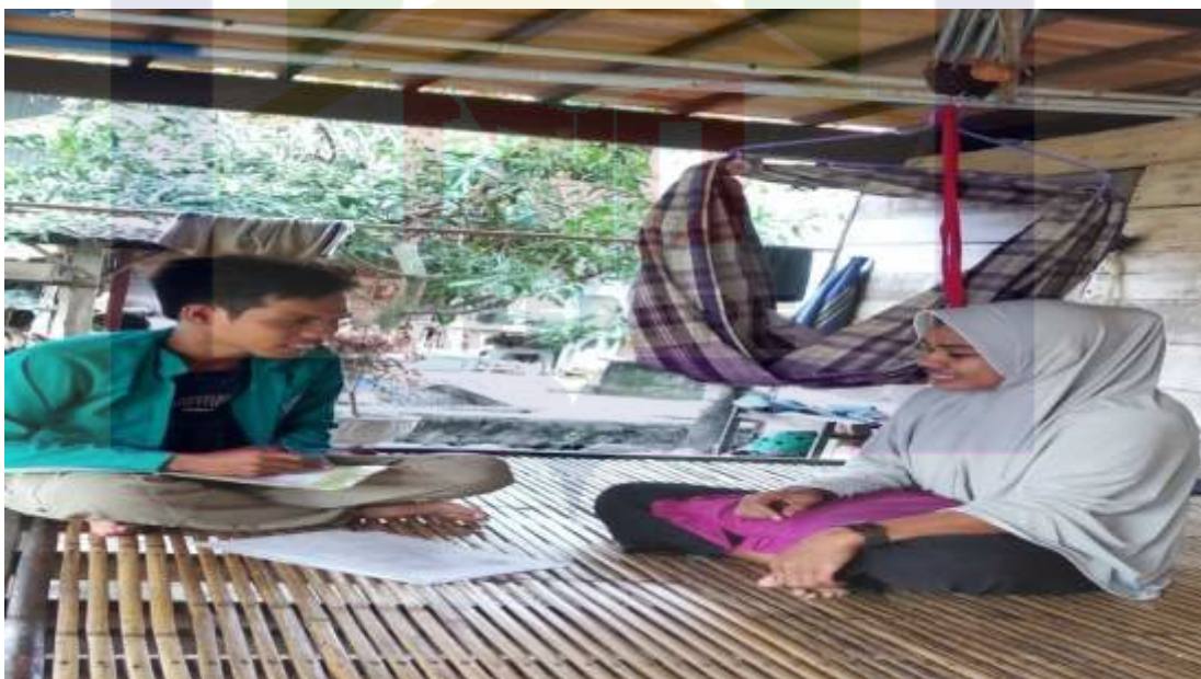
Wawancara Masyarakat Desa Mattiro Ade