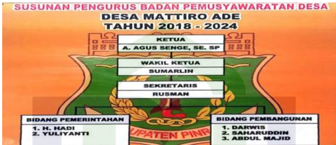
Gambar 3.2 Susunan Pengurus Badan Permusyawaratan Desa Desa Mattiro Ade.

Badan Permusyawaratan Desa adalah lembaga demokrasi dalam penyelenggaraan pemerintah Desa yang ditetapkan berdasarkan musyawarah dan mufakat terdiri dari ketua, sekretaris dan anggota.