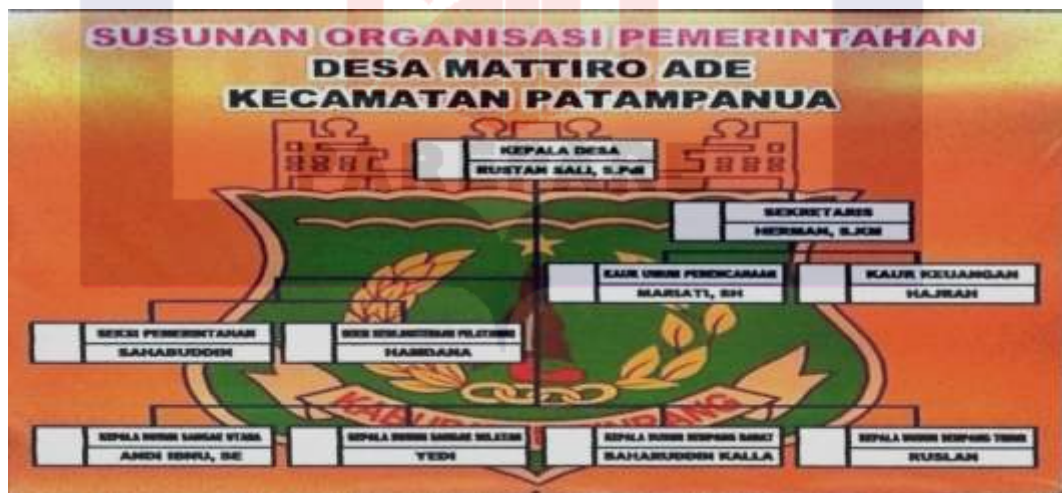
Gambar 3.1 Susunan Organisasi dan Tata Kerja Pemerintahan Desa Mattiro Ade.

Membantu pelayanan, pelaksanaan kegiatan pembangunan untuk meningkatkan kesejahteraan, pembangunan sarana prasarana, pengembangan potensi ekonomi, serta pemanfaatan sumber daya alam dan pengembangan desa yang berkelanjutan, adapun struktur organisasi Desa Mattiro Ade sebagai berikut;