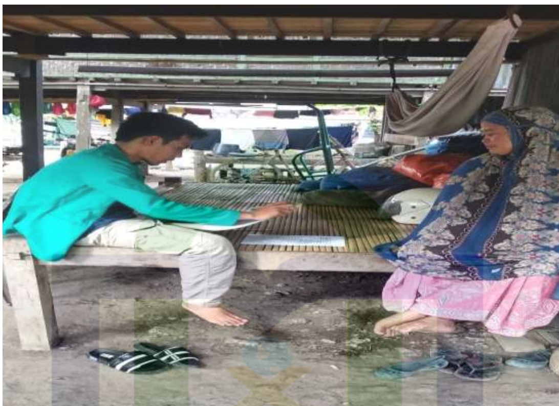
Wawancara Masyarakat Desa Mattiro Ade