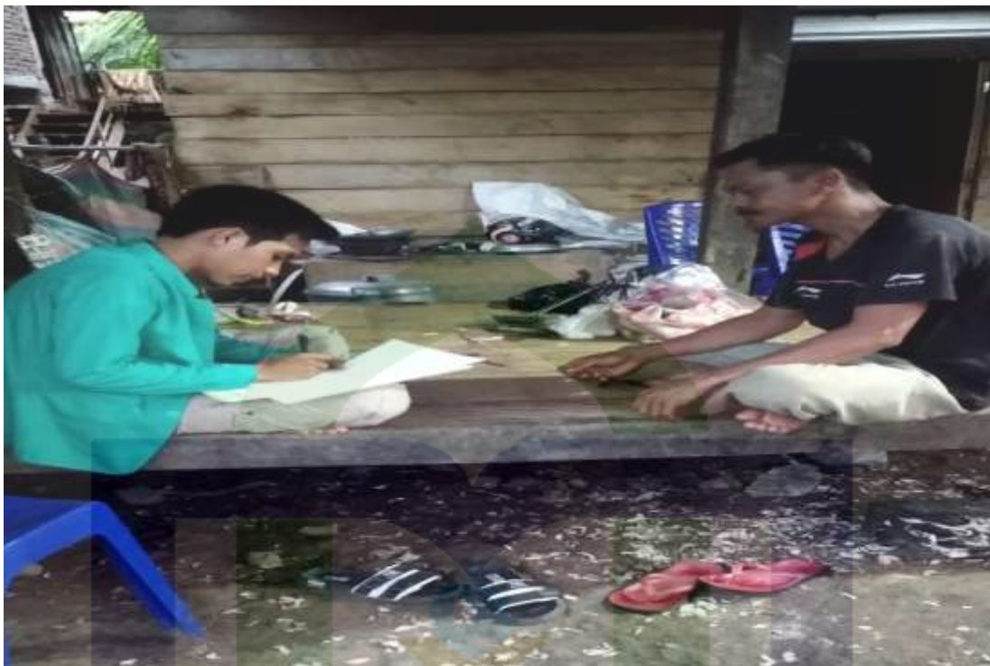
Wawancara Masyarakat Desa Mattiro Ade