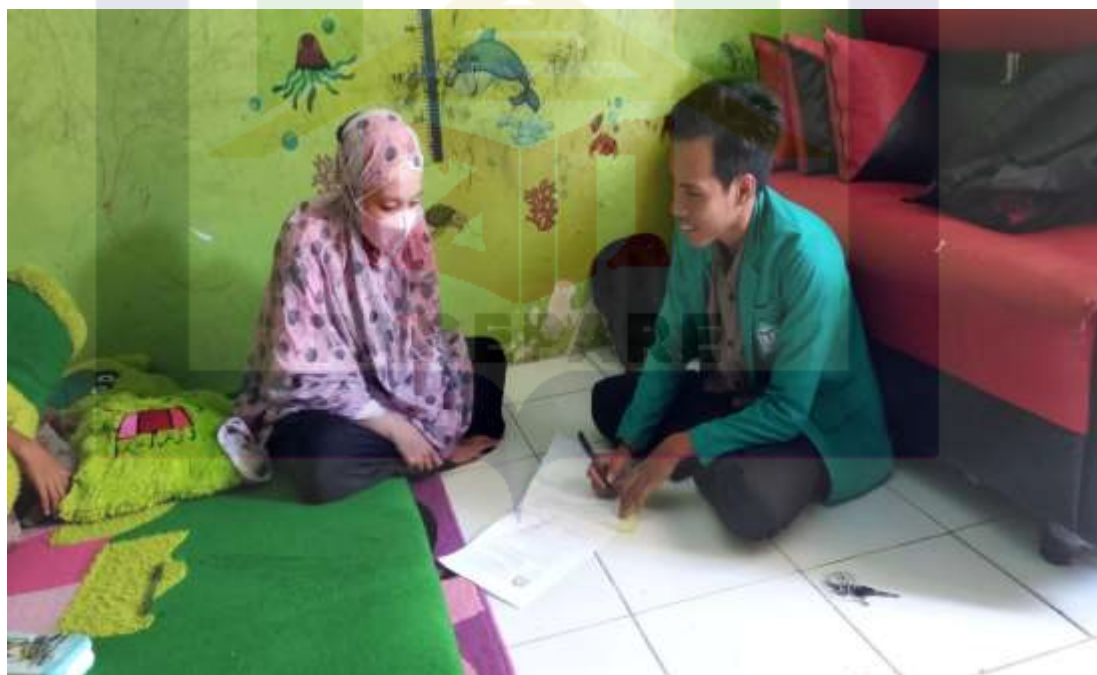
Wawancara Masyarakat Desa Mattiro Ade