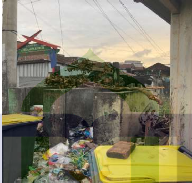
(Dokumentasi Tempat Sampah di Kelurahan Ujung Sabbang)