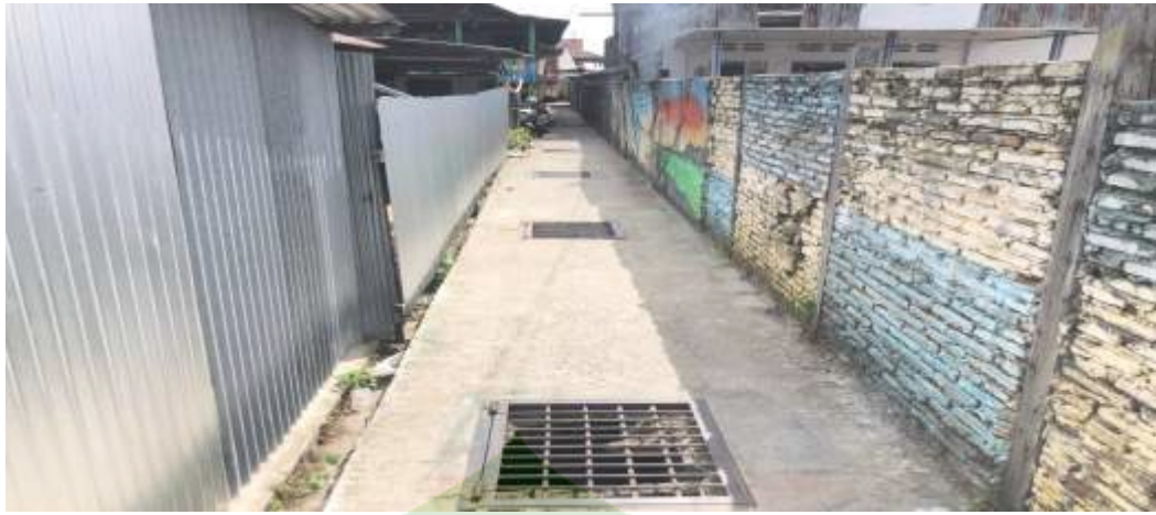
(Dokumentasi Hasil Pelaksanaan Program KOTAKU di Jl.Sulawesi)