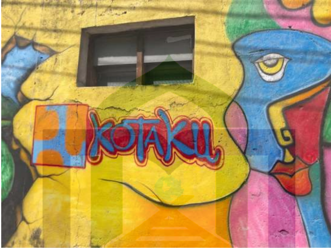
(Dokumentasi Hasil Pelaksanaan Program KOTAKU di Jl. Kalimantan