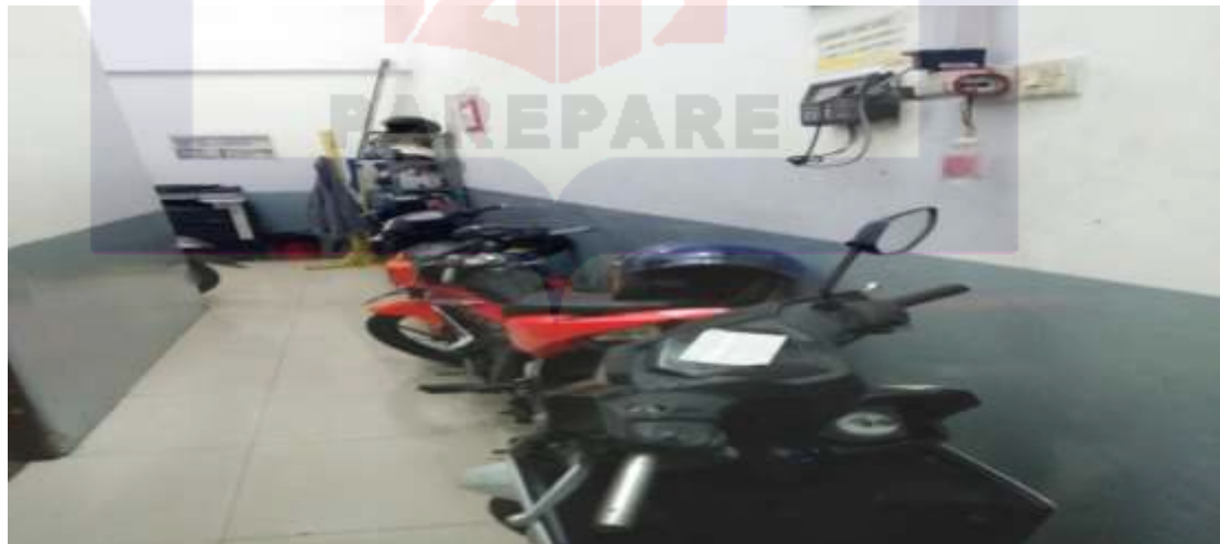
Gambar 6. Barang Sitaan Oleh Kredit Plus Kepada Nasabah Yang Melanggar