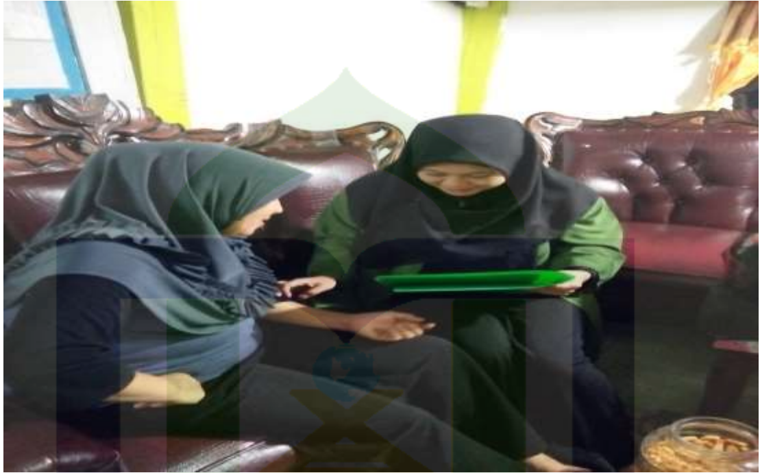
Gambar 5. Wawancara Dengan NasabahPT. Finansia Multi Finance (Kredit Plus) Parepare