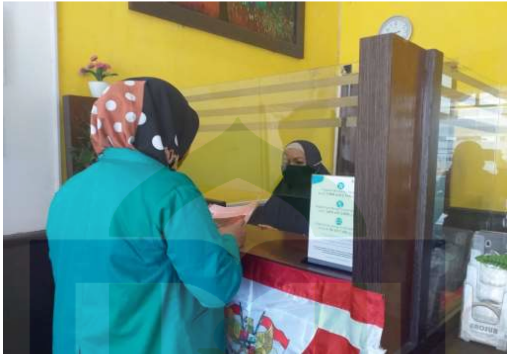
Gambar 1. Memasukkan Surat Ijin Penelitian