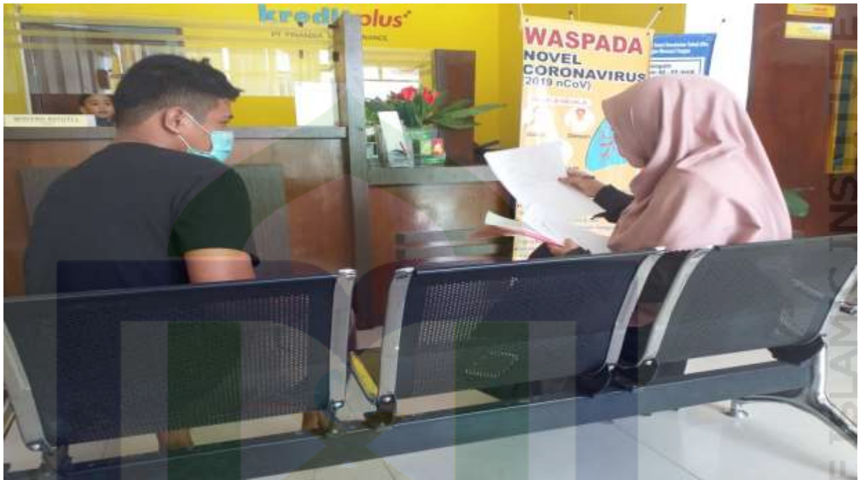
Gambar 3. Wawancara Dengan Nasabah PT. Finansia Multi Finance (Kredit Plus) Parepare