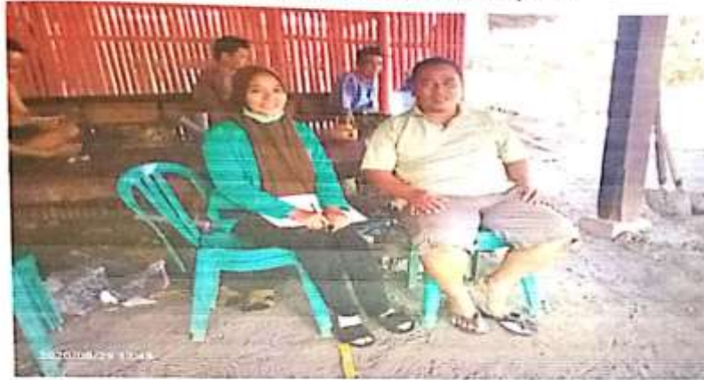
Foto Saat Melakukan Wawancara Dengan Tokoh Masyarakat