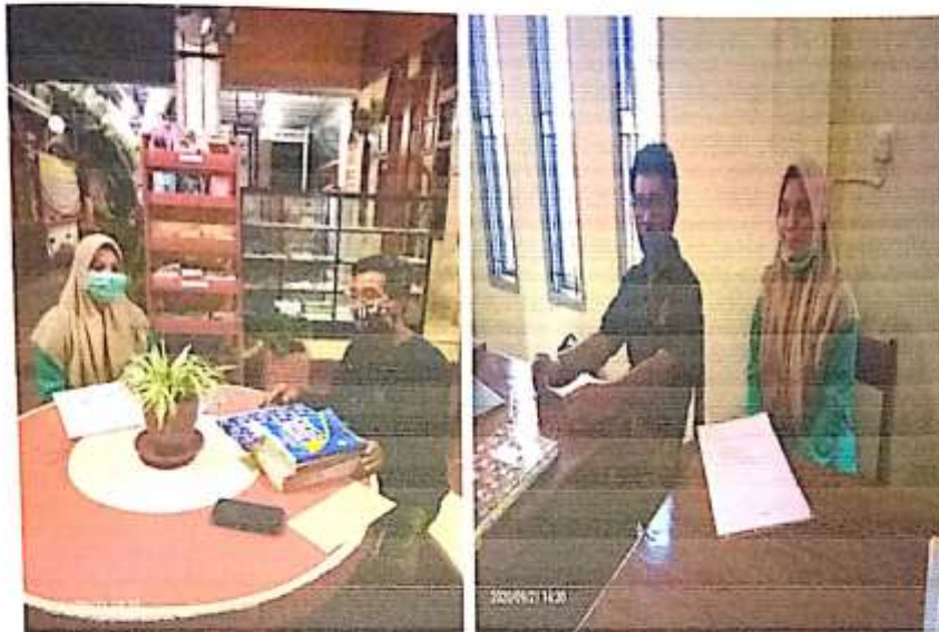
Foto Saat Melakukan Wawancara Dengan Kepala Desa Wanio