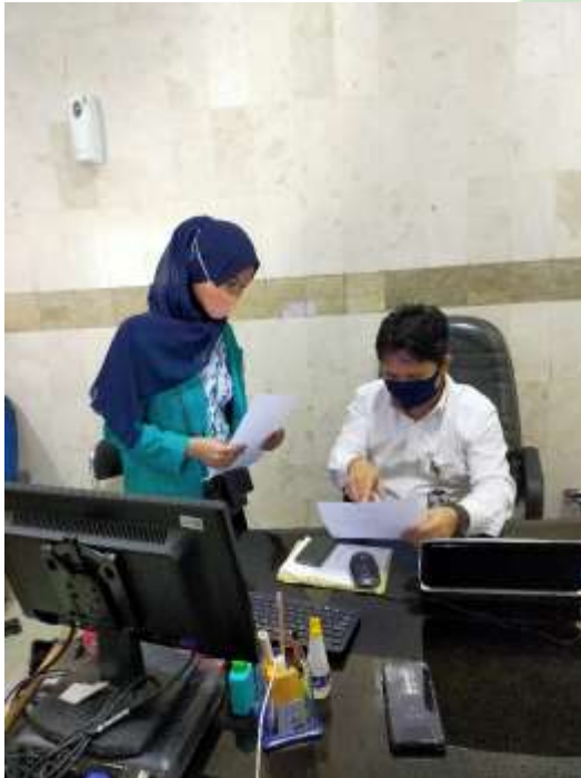
Wawancara Dengan Kordinator Bank Sulsebar KLS Cabang Pinrang