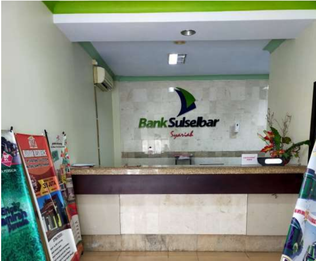
Tampilan Depan Bank Sulsebar KLS Cabang Pinrang