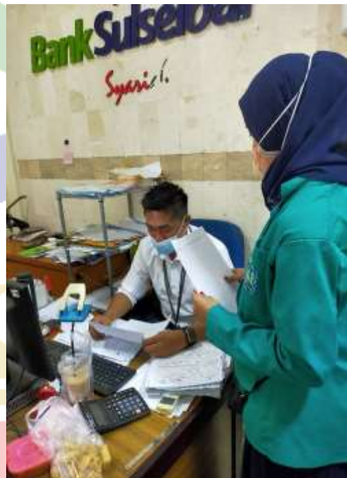
Wawancara Dengan Junior Analisis Bank Sulsebar KLS Cabang Pinrang