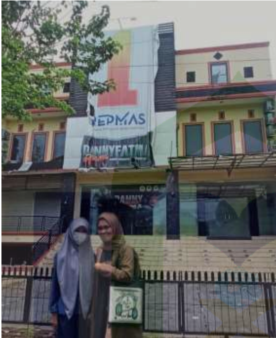
Lampiran 6: Dokumentasi di Kantor Perwakilan Bursa Efek Indonesia Makassar