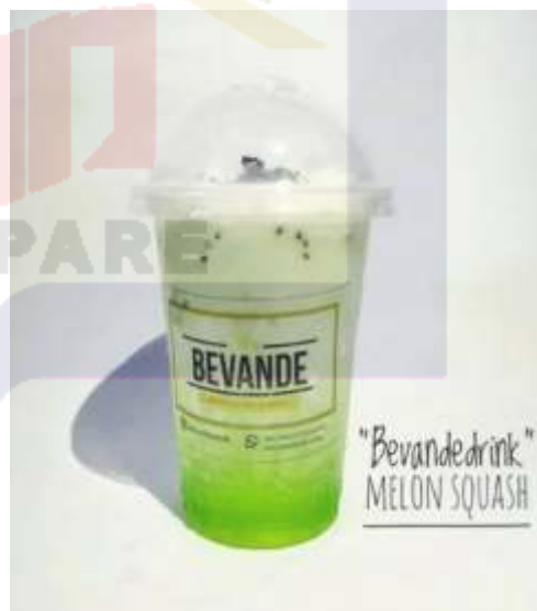
Produk yang ditawarkan oleh saudari Salma