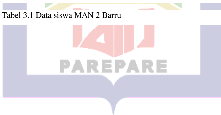
Tabel 3.1 Data siswa MAN 2 Barru